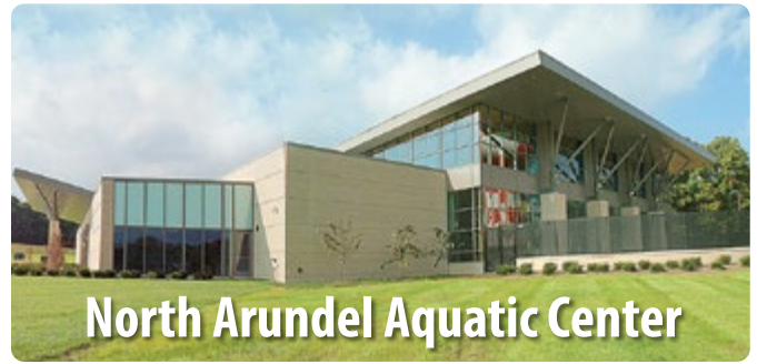
North Arundel Aquatic Center

Arundel Olympic Swim Center Cierra por competencias de natación en días limitados durante todo el año, llame al 410-222-7933 para obtener más información