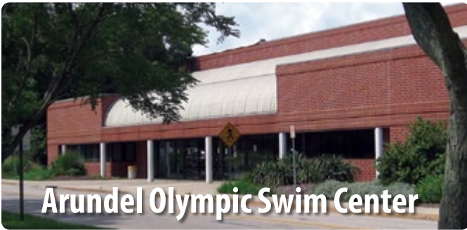
Arundel Olympic Swim Center

2690 Riva Road, Annapolis MD 21401 410-222-7933